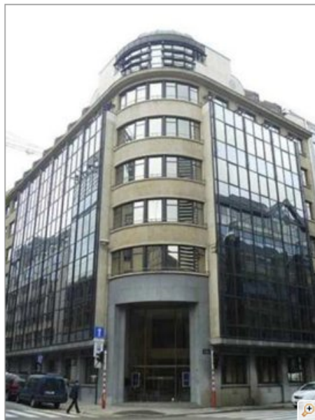
Höfuðstöðvar Eftirlitsstofnunar EFTA.

Eftirlitsstofnun EFTA (ESA) hefur í dag samþykkt ríkisaðstoð sem veitt var til endurskipulagningar á Arion banka og Landsbankanum.