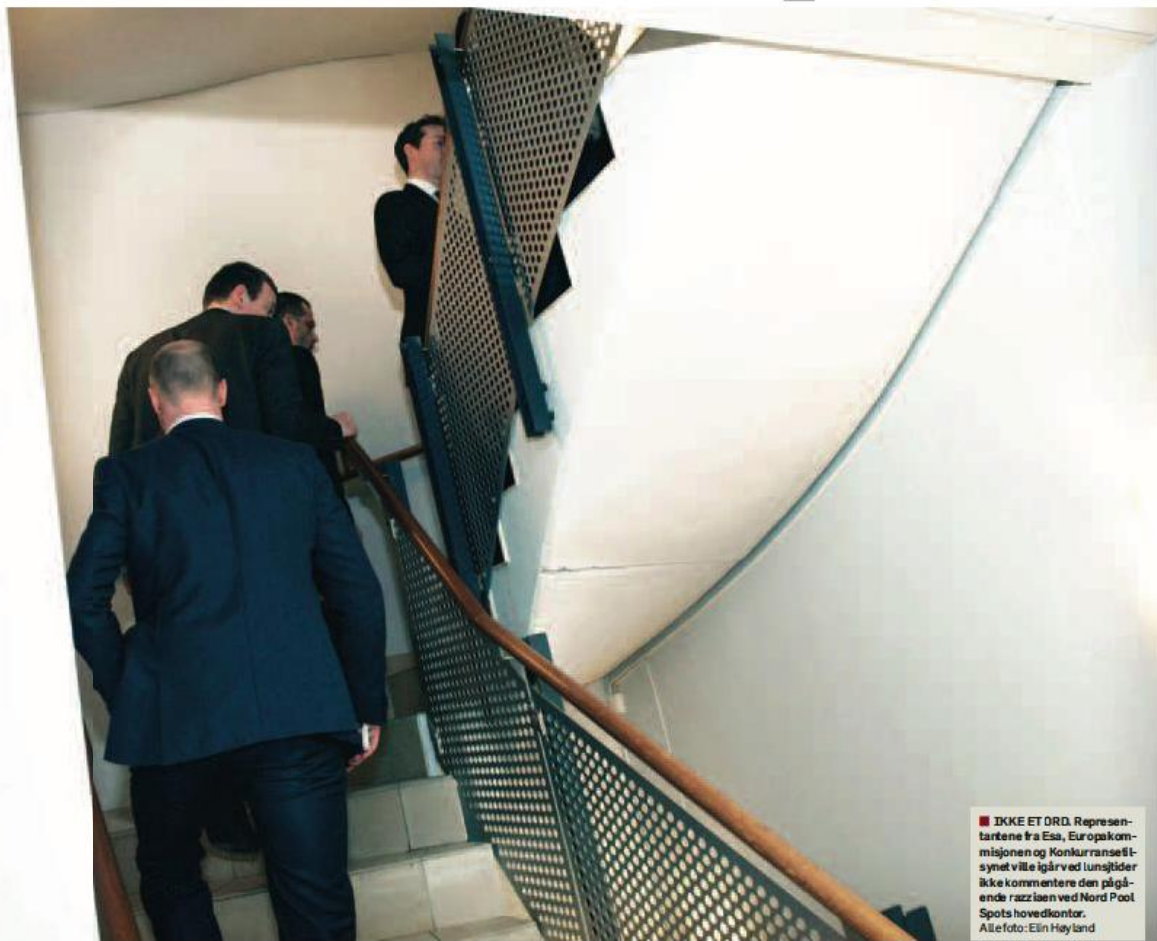
IKKE ET ORD. Representantene fra Esa, Europakommisjonen og Konkurransetilsynet ville igår ved lunsjtider ikke kommentere den pågående razziaen ved Nord Pool Spots hovedkontor.

– Har det vært mer ufor- melle samtaler om slik fusjon? – Ingen kommentar.