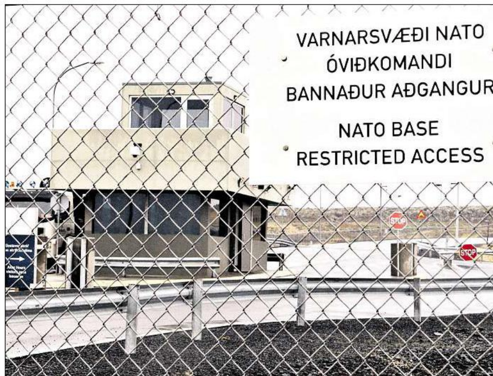
Det islandske selskapet Verne kjøpte i sin tid to hangarer på den nå nedlagte NATO-basen på Keflavik ved Reykjavik. Planen var å leie dem ut til IT-selskaper som var på jakt etter lokaler til sine serverparker.